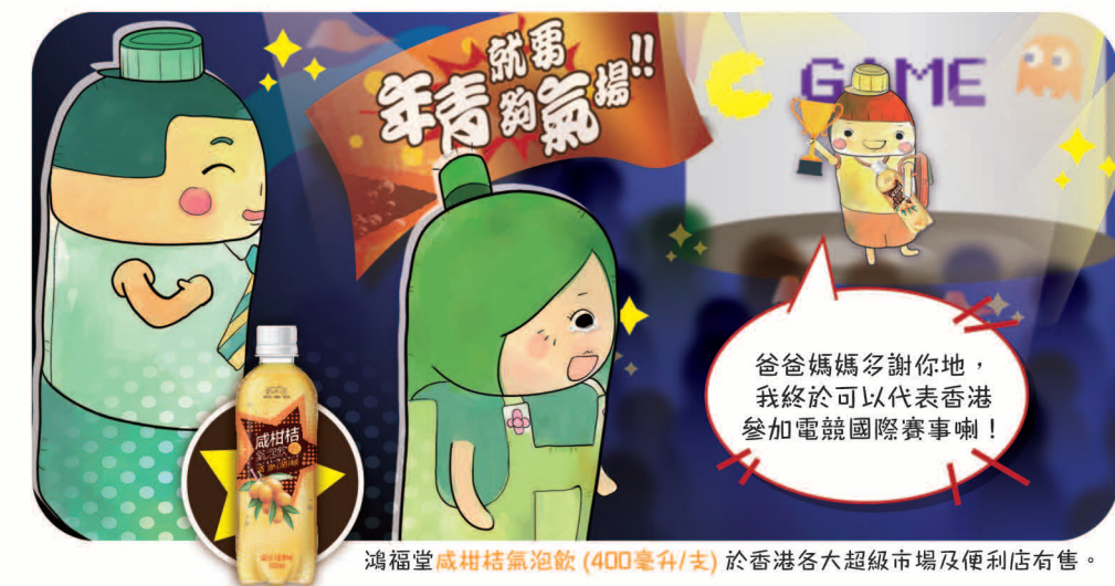
鴻福堂咸柑桔氣泡飲(400毫升/支)於香港各大超級市場及便利店有售。