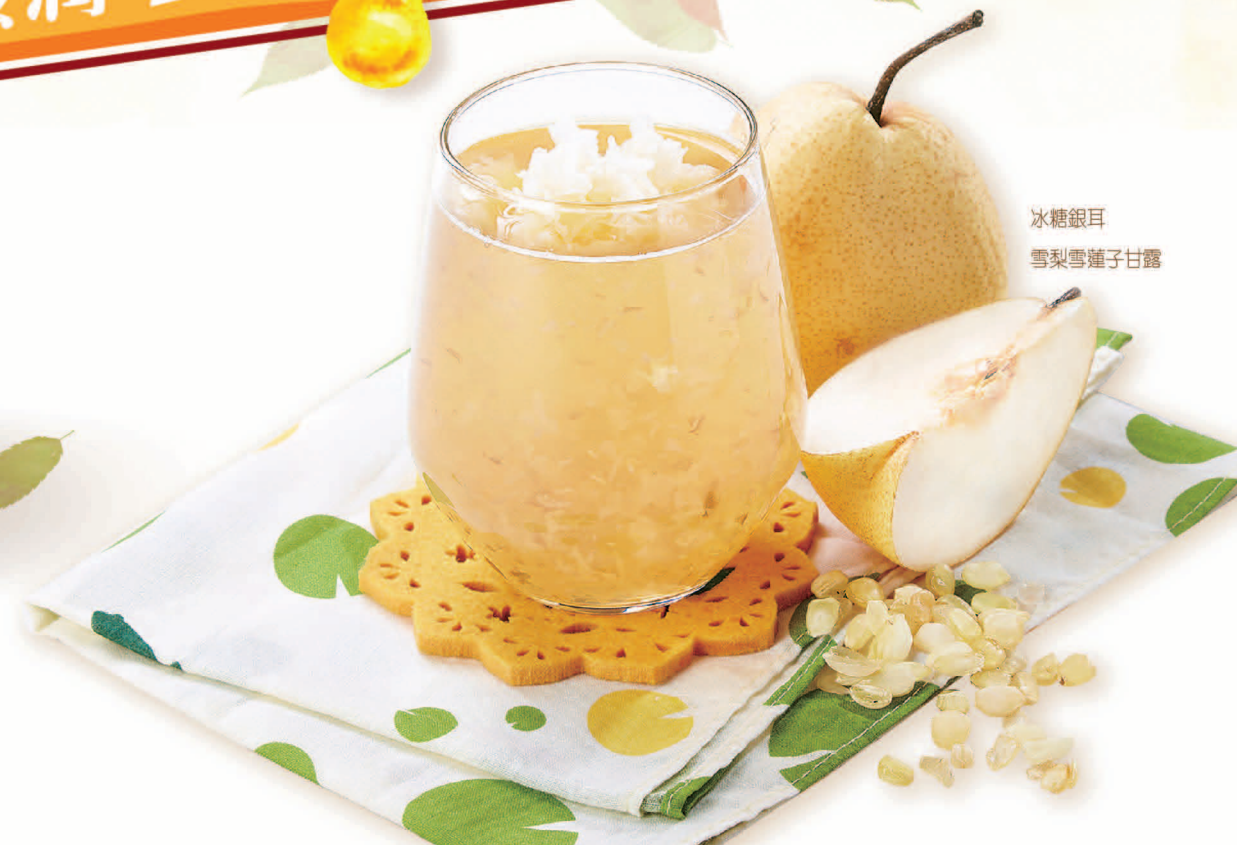
冰糖銀耳 雪梨雪蓮子甘露