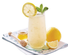
開胃化痰 日夏夏柚子檸檬甘露 功效：開胃化痰、潤澤肌膚 最啱您：胃口欠佳、食慾不振