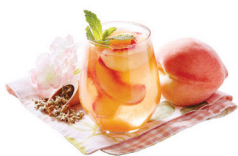
NEW 潤腸補血 蘋果花白桃紅茶(季節限定) 功效：通便潤腸、補血養顏 最啱您：腸道不暢、燥熱