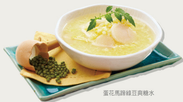
蛋花馬蹄綠豆爽糖水

清熱生津蛋花馬蹄綠豆爽糖水 $20 Dessert with Eggs, Water Chestnut and Mung Bean for Refreshing