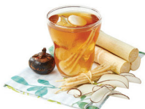
NEW 潤喉解暑 竹蔗茅根馬蹄海底椰 功效：清熱潤喉、生津止渴 最啱您：口渴、生疔滋