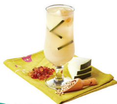
NEW 祛濕消腫 冬瓜桃膠薏米甘露(季節限定) 功效：祛濕消腫、排毒養顏 最啱您：皮膚粗糙、濕重腫脹