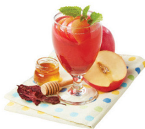
NEW 養顏排毒 紫背天葵蘋果蜂蜜甘露(季節限定) 功效：養顏排毒、保健通便 最啱您：膚色暗啞、大便不暢