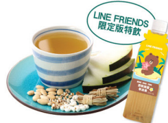
LINE FRIENDS 限定版特款 清熱消暑 冬瓜茶 功效：清熱消暑、生津除煩 最啱您：煩熱難消、口渴