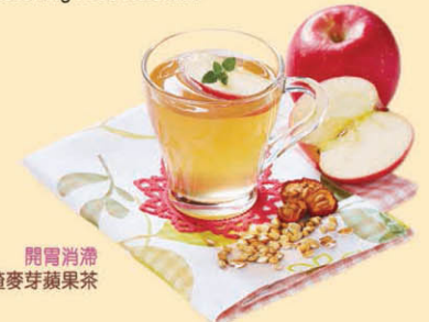
開胃消滯山楂麥芽蘋果茶