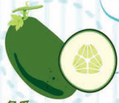
冬瓜 清熱解毒、消暑利水