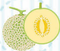
蜜瓜 有濃郁香氣、消暑熱、解渴利尿