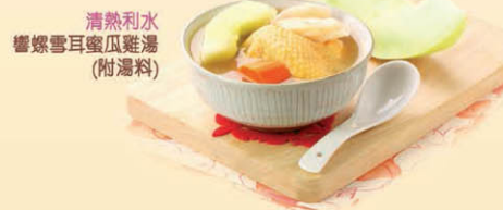
清熱利水響螺雪耳蜜瓜雞湯 (附湯料)