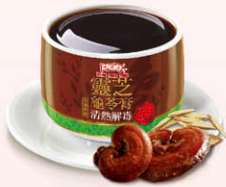
清熱解毒 靈芝龜苓膏