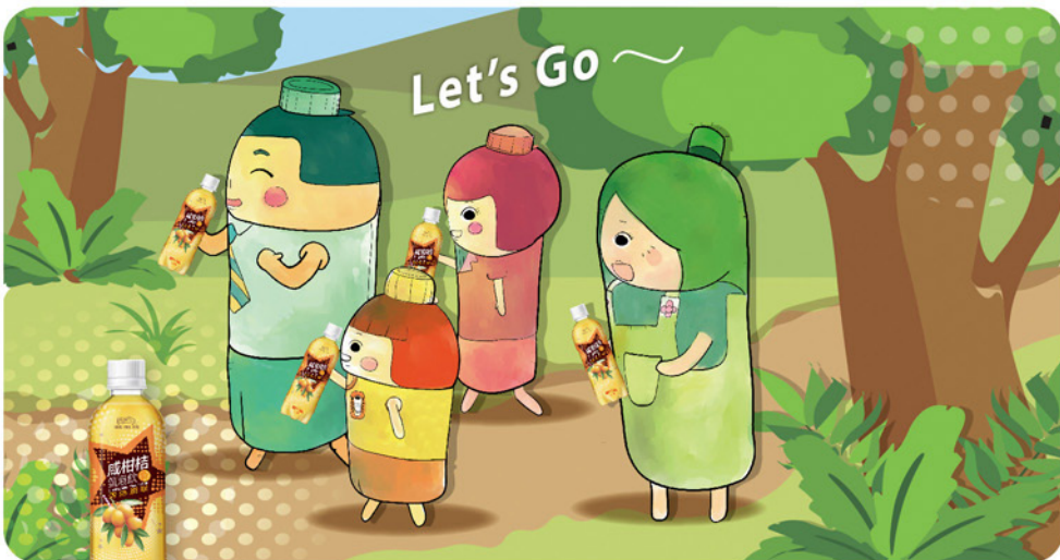
咸柑桔氣泡飲 (400毫升/支) 於香港各大超級市場及便利店有售。